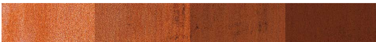
COR-TEN®-skiftning i färg över tid