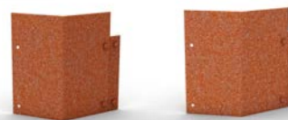
Hörndelar (köpes separat)